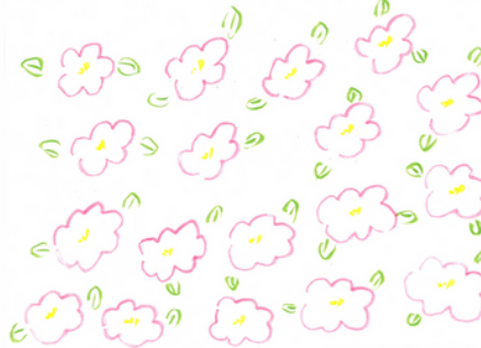
気分の良い時の作品